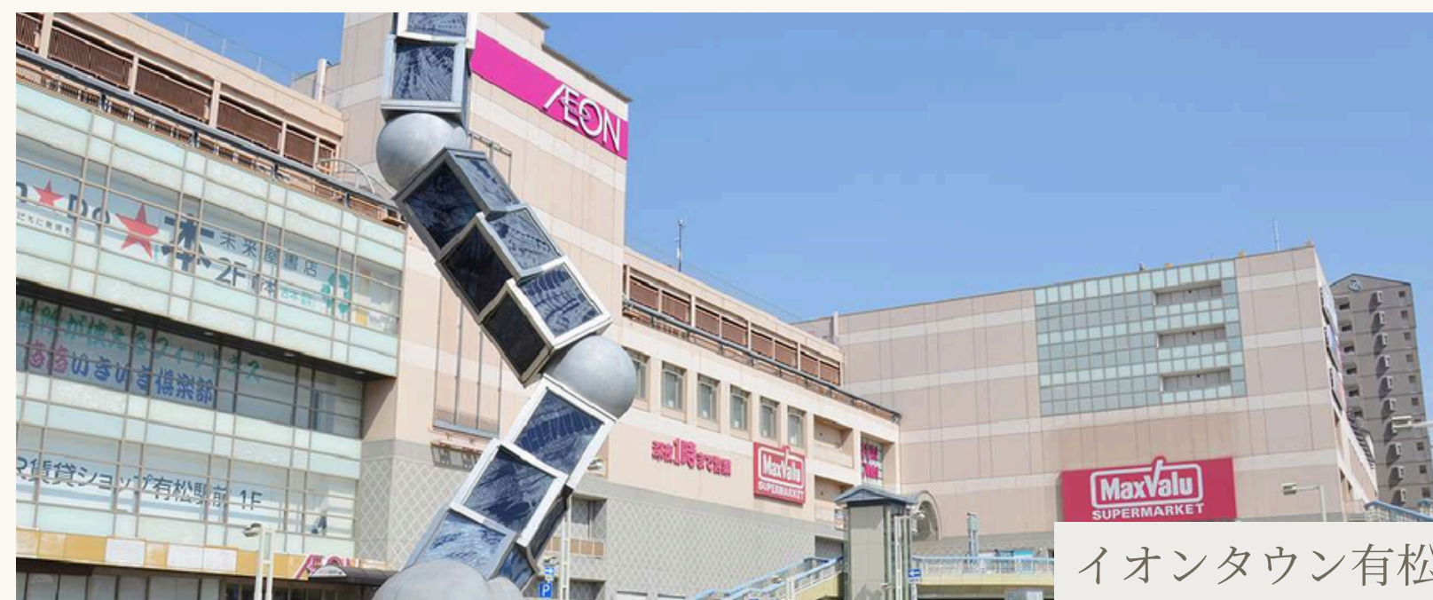
イオンタウン有松