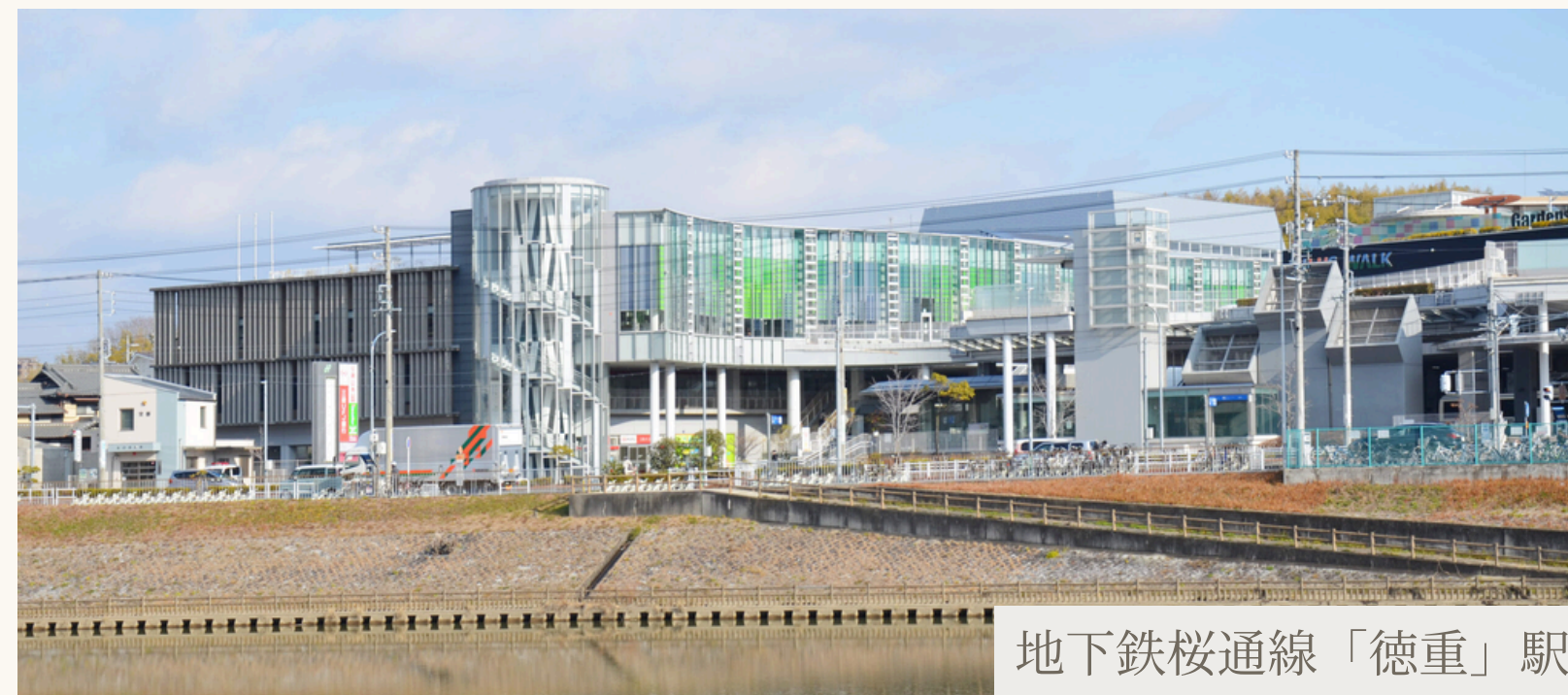
地下鉄桜通線「徳重」駅