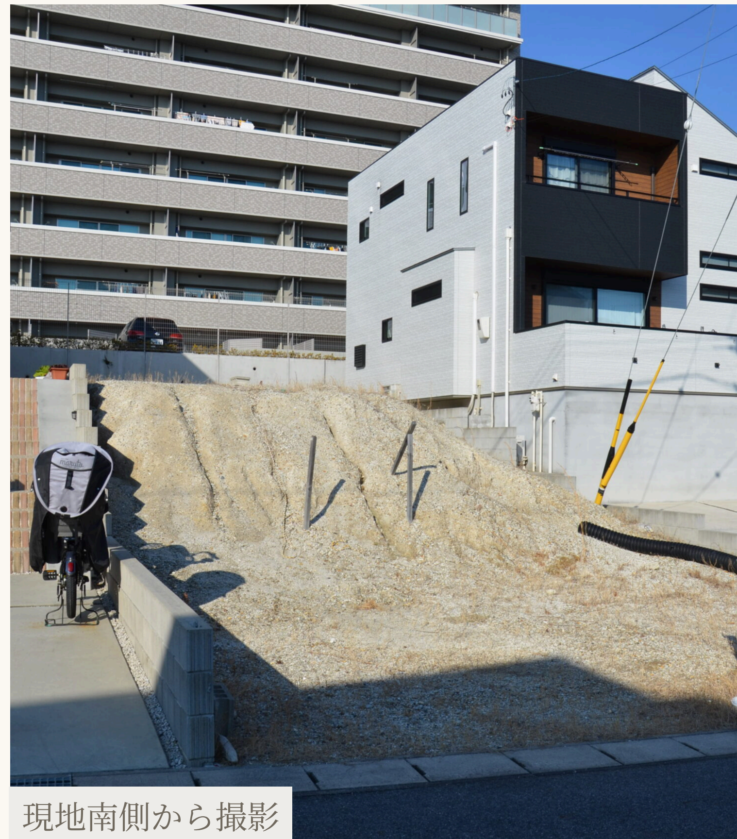
現地南側から撮影