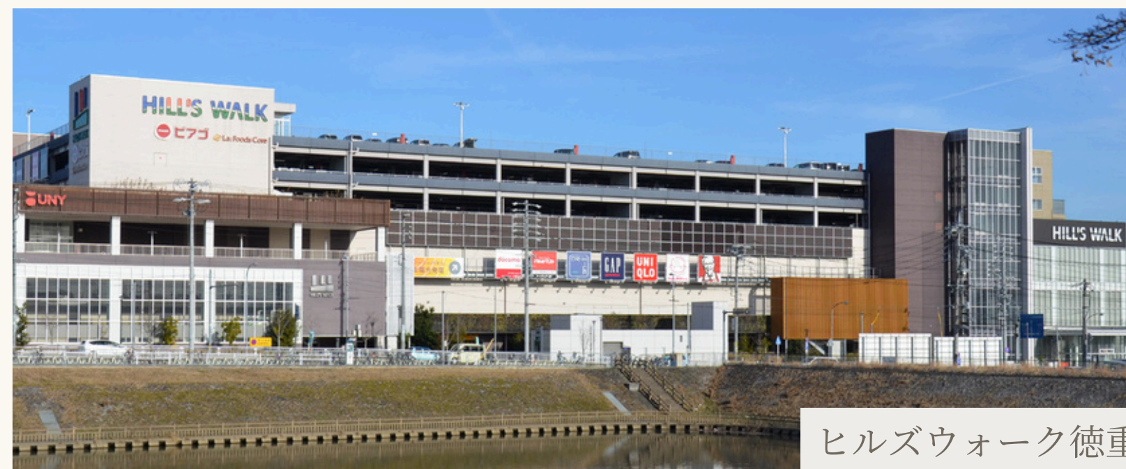
ヒルズウォーク徳重